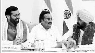
Haryana Chief Minister Sh. Bhupinder Singh Saini (left) attending a meeting in New Delhi on the Sardar Sarovar Link Canal issue, chaired by Union Jal Shakti Minister Sh. C. R. Pathi. Also present is Punjab Chief Minister Sh. Bhagwant Mann.