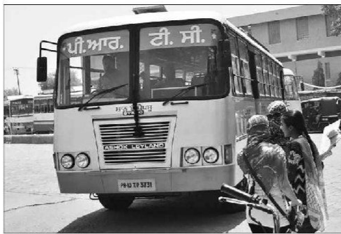
Punjab Roadways (File Photo)

Many passengers, who were unaware of the strike call, faced inconvenience at various bus stands in the state and were delayed to their respective destinations. The strike was called by the Punjab Roadways, Punjab, PRTC Contract Workers' Union to press